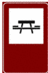
Figura II 362 Art. 136

Indica un ostello o un albergo per giovani.