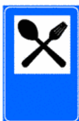
Figura II 367 Art. 136

Indica sulle strade extraurbane e sulle autostrade, un bar. Il colore è rispettivamente blu o verde.