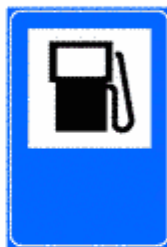
Figura II 356 Art. 136

Indica un punto telefonico lungo la viabilità extraurbana. Il colore di fondo del cartello è quello proprio della viabilità lungo la quale è installato.