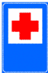
Figura II 353 Art. 136

Figure II.353, II.354, II.355, II.356, II.357, II.358 Art. 136