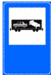
Figura II 373 Art. 136

Posto in vicinanza delle grandi stazioni ferroviarie avvia al servizio di trasporto auto.