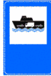
Figura II 374 Art. 136

Posto in vicinanza delle grandi stazioni ferroviarie avvia al servizio di trasporto auto al seguito del viaggiatore.