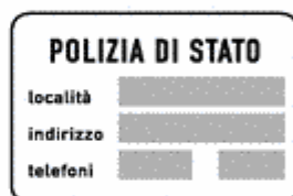
Figura II 379 Art. 136

Indica la sede più vicina di un posto, un comando, un ufficio di un organo di Polizia. Il segnale è installato lungo la viabilità extraurbana in prossimità del centro abitato e precisa la località, indirizzi e numeri telefonici. Per indicare successivamente la direzione del posto, comando od ufficio, si impiegano normali segnali di direzione, o di conferma, a fondo bianco.