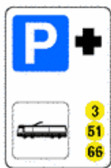
Figura II 369 Art. 136

Indica od avvia a un parcheggio di scambio ubicato vicino ad una fermata o un capolinea di servizi di pubblico trasporto.