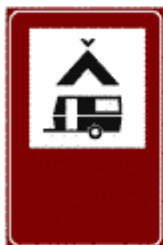
Figura II 363 Art. 136

Indica uno spazio attrezzato con panche e tavoli ove l'utente della strada possa fermarsi e sostare.