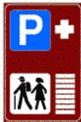
Figura II 371 Art. 136

PARCHEGGIO DI SCAMBIO IN CORRISPONDENZA DI ITINERARI TURISTICI OD ESCURSIONISTICI A PIEDI