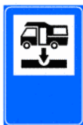
Figura II 377 Art. 136

Indica un'area attrezzata con impianti igienico-sanitari atti ad accogliere i residui organici e le acque chiare e luride raccolti negli impianti interni delle autocaravan, ed altri veicoli dotati di tali impianti di raccolta. Il colore di fondo del cartello è quello proprio della viabilità lungo la quale è installato.