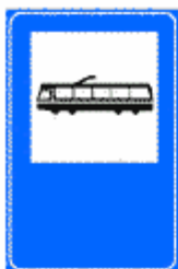
Figura II 359 Art. 136

Indica i punti di fermata di linee tramviarie di trasporto pubblico extraurbano, precisando, ove occorre, servizio, linee, destinazioni, orari, in apposito pannello integrativo.