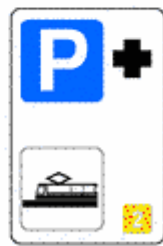
Figura II 370 Art. 136

Indica od avvia a un parcheggio di scambio ubicato vicino ad una fermata o un capolinea di servizi di pubblico trasporto.