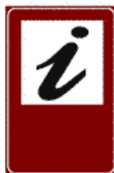
Figura II 360 Art. 136

Indica i punti di fermata di linee tramviarie di trasporto pubblico extraurbano, precisando, ove occorre, servizio, linee, destinazioni, orari, in apposito pannello integrativo.