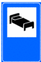
Figura II 365 Art. 136

Indica sulle strade extraurbane e sulle autostrade, un motel o un albergo. Il colore è rispettivamente blu o verde.