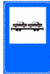
Figura II 372 Art. 136

PARCHEGGIO DI SCAMBIO IN CORRISPONDENZA DI ITINERARI TURISTICI OD ESCURSIONISTICI A PIEDI