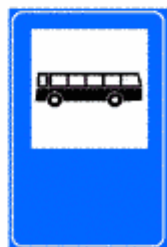
Figura II 358 Art. 136

Il colore di fondo del cartello è quello proprio della viabilità lungo la quale è installato.