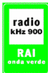
Figura II 364 Art. 136

Indica la vicinanza di una struttura ricettiva attrezzata ed autorizzata per tende, caravan e autocaravan.