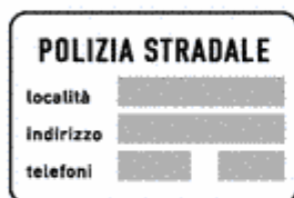
Figura II 378 Art. 136

Indica un'area attrezzata con impianti igienico-sanitari atti ad accogliere i residui organici e le acque chiare e luride raccolti negli impianti interni delle autocaravan, ed altri veicoli dotati di tali impianti di raccolta. Il colore di fondo del cartello è quello proprio della viabilità lungo la quale è installato.