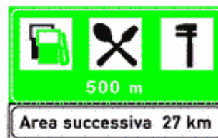
Figura II 376 Art. 136

Indica l'ubicazione di un posteggio di autovetture in servizio pubblico.