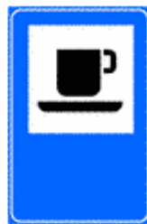
Figura II 366 Art. 136

Indica sulle strade extraurbane e sulle autostrade, un motel o un albergo. Il colore è rispettivamente blu o verde.