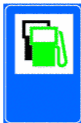
Figura II 357 Art. 136

Simbolo nero = benzina ordinaria. Il colore di fondo del cartello è quello proprio della viabilità lungo la quale è installato.