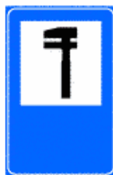
Figura II 354 Art. 136

Indica od avvia ad un posto sanitario organizzato per interventi di primo soccorso. Il colore di fondo del cartello è quello proprio della viabilità lungo la quale è installato.