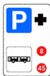
Figura II 368 Art. 136

Indica sulle strade extraurbane e sulle autostrade, un ristorante. Il colore è rispettivamente blu o verde.