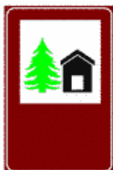
Figura II 361 Art. 136

Indica un posto di informazioni turistiche o di altra natura.