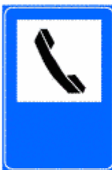
Figura II 355 Art. 136

Indica un'officina sita lungo la viabilità extraurbana. Il colore di fondo del cartello è quello proprio della viabilità lungo la quale è installato.